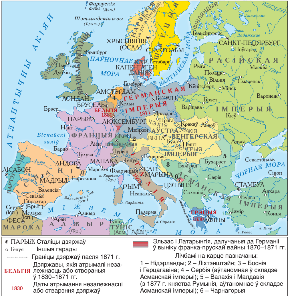
Еўропа ў 1871 г.

Знайдзіце на картасхеме дзяржавы, якія здоблілі незалежнасць у XIX ст.