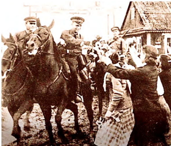
Сустрэча РСЧА. Заходняя Беларусь. 1939 г.