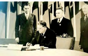
К. Кісялёў падпісвае Статут ААН 26 чэрвеня 1945 г.