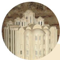
Полацкая, Тураўская і іншыя землі. Старажытнаруская дзяржава