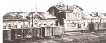
Аляксандраўская чыгунка. Станцыя Мінск. 1914 г.