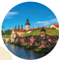
Вялікае Княства Літоўскае