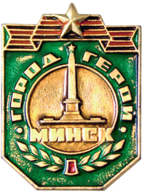
Значок «Город-герой Минск». 1976 г.

Широкую известность получили подвиги обольских подпольщиков. Комсомольская организация