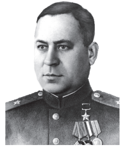
А. Е. Клещев. Председатель Совета Министров БССР (1948–1953)

Как вы думаете, почему руководителями различного уровня в послевоенной БССР становились организаторы освободительной борьбы? В каких ветвях власти занимали должности В. И. Козлов, В. Е. Лобанок и А. Е. Клещев? Назовите фамилии современных руководителей данных ветвей власти в Республике Беларусь.