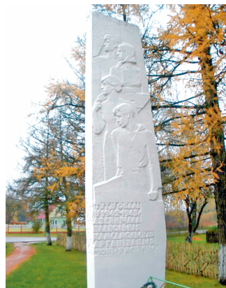
Памятник Обольскому комсомольскому подполью. Г. п. Оболь

С началом освобождения территории Беларуси от немецко-фашистских захватчиков высшие органы государственной власти вернулись в республику. 26 ноября 1943 г. Красная армия освободила первый областной центр БССР — г. Гомель. Вскоре сюда из Москвы переместились ЦК КП(б)Б, СНК БССР