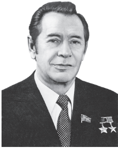
П. М. Машеров. Первый секретарь ЦК КПБ (1965–1980)