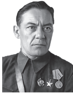
В. И. Козлов. Председатель Президиума Верховного Совета БССР (1948–1967)