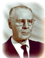
К. Горев, президент Академии наук Белорусской ССР

Наряду с эксплуатацией местного населения и советских военнопленных оккупанты вывозили с территории Беларуси промышленное оборудование и сырье. Реквизициям или уничтожению подвергались и культурные ценности республики.