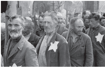
Евреи Могилевского гетто с нагрудными нашивками в виде звезды Давида

Средством реализации политики геноцида были карательные операции . Они преследовали три основные задачи: решение «партизанского вопроса»