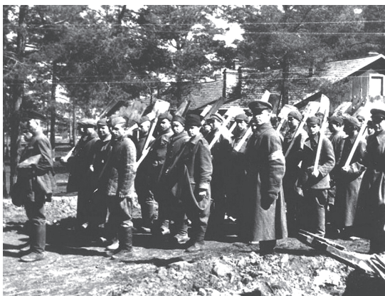
Рабочая команда из Шталага-352 отправляется на строительство дороги. Д. Масюковщина (сейчас г. Минск)

Экономическая политика оккупантов подразумевала вывоз из БССР максимального количества продовольствия и сырья. Уже с 1942 г. оккупационные власти стали широко использовать советских военнопленных в качестве рабочей силы и отправлять население оккупированных территорий, прежде всего молодежь, на принудительные работы в Германию .