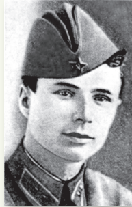
А. Н. Сивачев (1918–1941) Начальник 1-й погранзаставы Августовского пограничного отряда