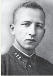
В. М. Усов (1916–1941) Герой Советского Союза. Начальник 3-й погранзаставы Августовского пограничного отряда