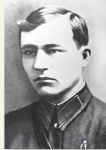
А. М. Кижеватов (1907–1941) Герой Советского Союза. Начальник 9-й погранзаставы Брестского погранотряда