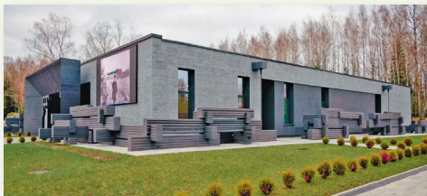
Музей в Хатыни