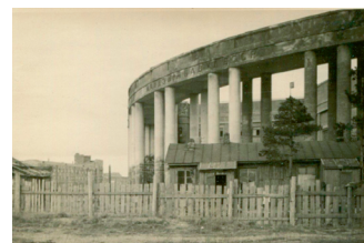
Здание Академии наук БССР в годы войны

«С приходом в Минск немецких захватчиков книгохранилище с иностранной литературой и еврейской было занято под склад, а книги выброшены под лестницу, засыпаны мусором и залиты водой. В дальнейшем разгрому подверглась и остальная часть библиотеки... Из микроскопов были повывинчены окуляры и объективы. Лаборатории были превращены в уборные. Был выброшен на улицу архив Академии наук и сожжен... Убегая из Минска, гитлеровцы сожгли лабораторный корпус Академии, главный корпус, лабораторное здание ботанического сада и 30-квартирный дом».