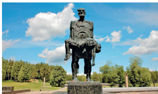
Скульптура «Непокоренный человек» в д. Хатынь

более 12 тыс. сожженных и разрушенных сельских населенных пунктов. Символом геноцида белорусского народа стала деревня Хатынь, жители которой 22 марта 1943 г. были заживо сожжены нацистами и украинскими коллаборационистами.