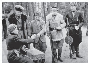
Партизаны идут на задание. 1943 г.

Коллораборационизм — осознанное, добровольное и умышленное сотрудничество с врагом в его интересах и в ущерб своему государству.