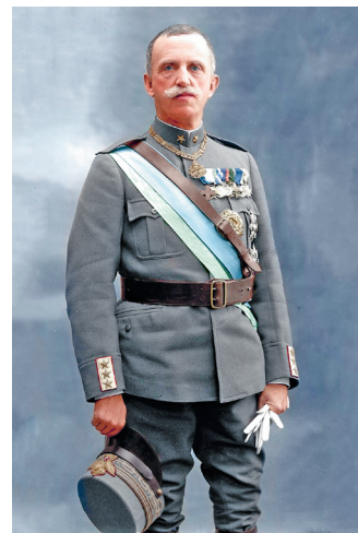
Виктор Эммануил III, король Италии (1900–1946)