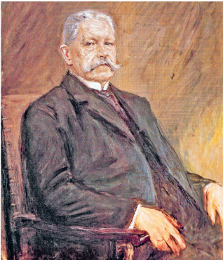
Пауль фон Гинденбург, президент Германии (1925–1934). Художник М. Либерман

3. Распространение фашизма в Европе. В условиях мирового экономического кризиса даже в государствах с устоявшимися демократическими традициями — США, Великобритании, Франции, Канаде, Скандинавских странах — сформировались фашистские или крайне националистические партии. Однако