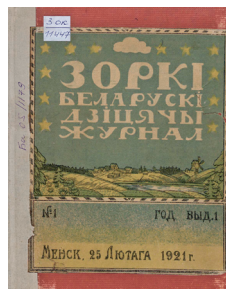
Журнал «Зоркі». 1921 г.