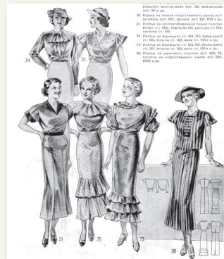
Мода 1930-х гг.

Сравните современную моду и моду 1920–1930-х гг. Определите отличия в женской моде 1920-х и 1930-х гг.