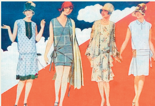
Мода 1920-х гг.