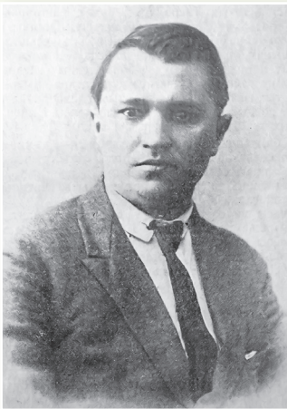
Д. Ф. Прищепов

Народный комиссар земледелия БССР в 1924–1929 гг. Д. Ф. Прищепов придерживался принципа свободы выбора крестьянами форм землепользования. Он считал, что «...социалистические элементы, особенно в сельском хозяйстве, нельзя создать сразу, в один-два года... Основная форма, которая будет объединять мелкие крестьянские хозяйства... это производственная кооперация». Он отмечал, что «нет плохой земли, есть плохие хозяева. И то, сколько зерна снимет мужик со своего поля, сколько и какого молока даст его корова, прежде всего зависит от него самого, наконец, от его отношения к труду. В нынешних условиях крестьянское хозяйство носит товарный характер, и чем больше оно будет продавать продуктов своего производства на рынок, тем оно [будет] мощнее и доходнее».