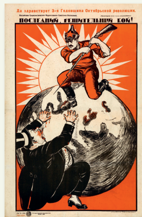
Плакат времен Гражданской войны

Гражданская война стоила России огромных жертв. Война привела к дальнейшему ухудшению экономической ситуации в стране, к полной хозяйственной разрухе. В результате военных действий, от холода, болезней и террора погибло, по разным подсчетам, от 8 до 13 млн человек.