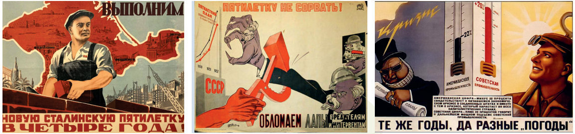
Советские плакаты, посвященные индустриализации

благоприятные условия для развития легкой промышленности.