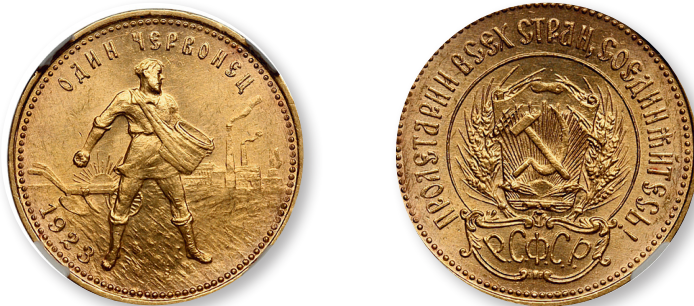
Советский червонец 1923 г.

лись рыночные отношения, небольшие частные предприятия, наем рабочей силы, свобода торговли, привлечение иностранного капитала, отменялись карточная система и уравнительное распределение, трудовые армии и трудовая повинность. При этом государство сохраняло свои позиции в банковской сфере, на крупных и части средних предприятий. Это потребовало развития кооперации, совершенствования налоговой системы и проведения денежной реформы, которая создала конвертируемую валюту (червонец).