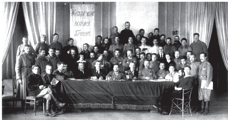
Совместное заседание ВВР и Центральной белорусской войсковой рады. 1917 г.

ное самосознание крестьянства, самого многочисленного класса белорусского общества, не отличалось высоким уровнем.