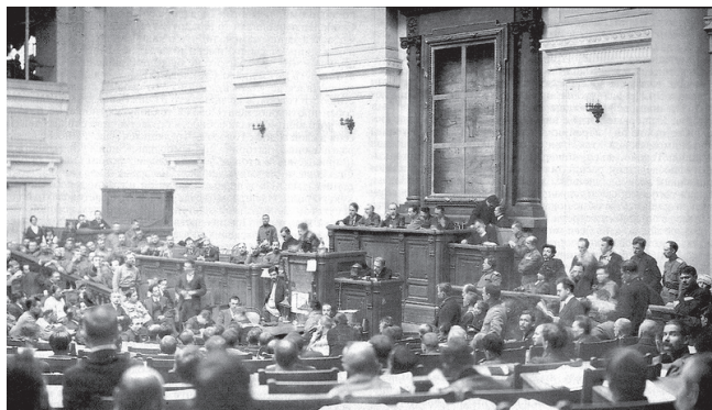
1 Всероссийский съезд Советов рабочих и солдатских депутатов

Воспользовавшись ситуацией, большевики организовали в Петрограде манифестации под лозунгом «Вся власть Советам!». Временное правительство при поддержке Петросвета эти выступления подавило. Период двоевластия закончился, так как Советы перешли на позицию полной поддержки Временного правительства. Новое Временное правительство, в которое вошли восемь кадетов и близких к этой партии политиков и семь министров, представлявших умеренные социалистические партии эсеров и меньшевиков, возглавил эсер А. Керенский.