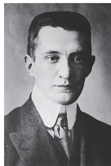
А. Ф. Керенский

Воспользовавшись ситуацией, большевики организовали в Петрограде манифестации под лозунгом «Вся власть Советам!». Временное правительство при поддержке Петросвета эти выступления подавило. Период двоевластия закончился, так как Советы перешли на позицию полной поддержки Временного правительства. Новое Временное правительство, в которое вошли восемь кадетов и близких к этой партии политиков и семь министров, представлявших умеренные социалистические партии эсеров и меньшевиков, возглавил эсер А. Керенский.