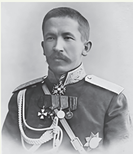
Лавр Георгиевич Корнилов

Активное участие большевиков в борьбе с корниловским мятежом повысило их популярность. Они завоевали большинство в Петроградском и Московском советах. А Временное правительство все более утрачивало возможность влиять на ситуацию в стране. Нарастал экономический кризис, крупные города столкнулись с угрозой голода. Росло стачечное движение. Сложной была ситуация на фронте.