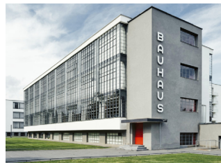
Школа Баухауз. Г. Дессау (Германия)