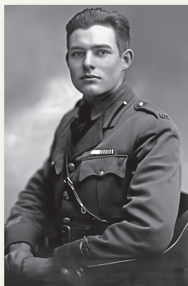
Эрнест Хемингуэй. 1918 г.

Знаменитый американский писатель Эрнест Хемингуэй ушел на фронт добровольцем в 1918 г., был ранен. В годы гражданской войны в Испании стал военным корреспондентом, находился в осажденном фашистами Мадриде.