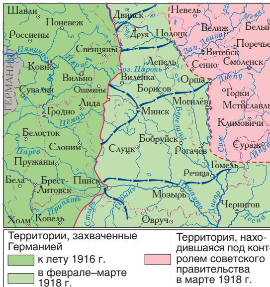
Территория Беларуси, захваченная Германией в Первой мировой войне

В 1916 г., в очередной раз спасая союзников, которые оказались в тяжелом положении в битве под Верденом,