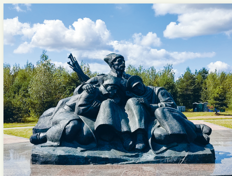
Мемориальный комплекс памяти героев и жертв Первой мировой войны. Г. Сморгонь