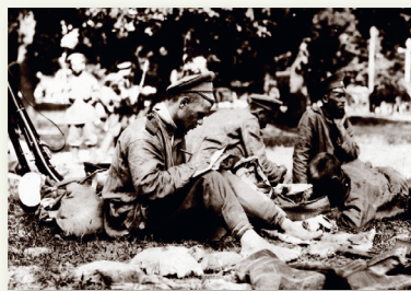
Российские солдаты пишут письма домой