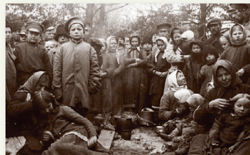
Лагерь беженцев в г. Слуцк