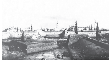
Бобруйская крепость. XIX в.

Подумайте, что значит выражение «двунадесять языков».