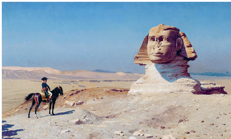
Бонапарт перед сфинксом. Художник Жером Жан-Леон

Какой поход армии Наполеона вдохновил живописца? Какие ассоциации вызывает эта картина у вас?