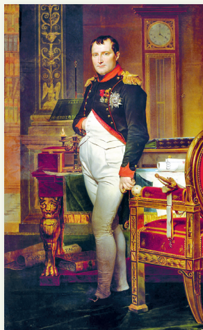
Император Наполеон в своем кабинете в Тюильри. Художник Давид Жак-Луи

Пользуясь дополнительными источниками информации, составьте таблицу «Итоги наполеоновских войн», отразив в них результаты всех вышеприведенных военных кампаний. Сделайте вывод о влиянии наполеоновских войн на развитие Европы в начале XIX в.