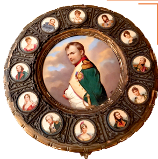
Столешница с портретами Наполеона и членов его семьи

Подумайте, с какой целью Наполеон Бонапарт делал своих родственников монархами европейских государств.