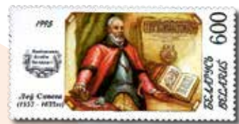
Леў Сапега. Паштовая марка. 1995 г.

Канцлер ВКЛ Леў Сапега ў адказ на дзеейні ўніяцкага лідара Іясафата Кунцэвіча пісаў: «Ваша святасць, як ты яе [унію] разумееш, дазваляе вам рабаваць схізматаў (праваслаўных) і адсякаць ім галовы. Евангелле вучыць зусім іншым рэчам. Гэтая унія выклікала велізарнае няшчасце... Унія не прынесла радасці, а толькі нязгоду, сваркі, непарадкі. Было б нашмат лепей, каб яна ніколі не мела месца сярод нас...».