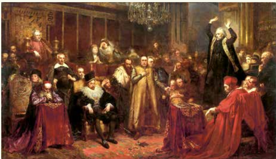
Пропаведзь Скаргі. Мастак Я. Матэйка. 1864 г.

Як вы лічыце, чаму ідэя аб'яднаць дзве царквы была рэалізавана менавіта на тэрыторыі Рэчы Паспалітай у XVI ст.?