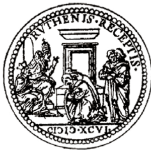
Медаль з надпісам «Русіны прынятыя» (з лац.)

Паводле ўмоў заключанай уніі Кіеўская мітраполія захоўвала ранейшыя царкоўныя абрады, царкоўныя святы, праваслаўныя святары былі прыроўнены ў правах да каталіцкіх святароў, на царкоўныя пасады маглі прызначацца толькі «рускія» людзі, уніятаў