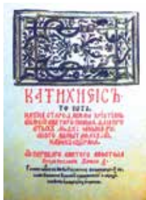
Катэхізіс С. Буднага. Нясвіж. 1562 г.

Праз чатыры гады ў Вільні адбыўся першы з’езд «евангелістаў», быў заснаваны кальвінскі збор (царква), арганізавана Літоўская кальвініцкая губерня. Магнат пачаў укараняць новае вучэнне на падкантрольных яму землях, перадаючы цэрквы і касцёлы кальвініцкім прапаведнікам. Для прапаганды рэфармацыйных поглядаў пры яго падтрымцы былі заснаваны тыпаграфіі ў Нясвіжы і Брэсце. У 1562 г. у Нясвіжы Сымон Будны выдаў «Катэхізіс» на старабеларускай мове.