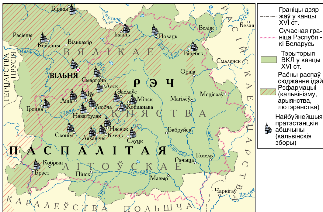
Рэфармацыйны рух у ВКЛ

Кім і калі быў заснаваны ордэн езуітаў? Якія былі яго мэты і метады дзейнасці?