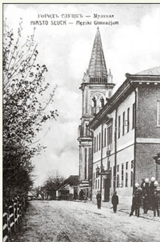
Слуцкая гімназія. Паштоўка. Пачатак XX ст.