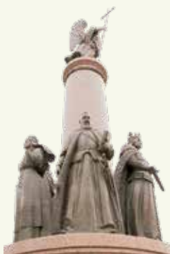
Помнік 1000-годдзю г. Брэста

Неўзабаве з каталіцызму ў кальвінізм перайшлі буйныя палітычныя дзеячы краіны Мікалай Радзівіл Руды, Ян Кішка, з праваслаўя — Астафій Валовіч, Юры Зяновіч, Васіль Тышкевіч і інш. Пры іх падтрымцы ў многіх гарадах Беларусі былі арганізаваныя кальвініцкія абшчыны з малітоўнымі дамамі, школамі, бальніцамі, тыпаграфіямі. Пашырэнне кальвінізму сярод магнатаў і шляхты зрабілася настолькі значным, што ў 1569 г. большасць паноў-рады ВКЛ былі прыхільнікамі Рэфармацыі. Дзякуючы намаганням пратэстанцкай знаці ў 1573 г. быў прыняты Акт Варшаўскай канфедэрацыі, які абвясціў свабоду веравызнання для знаці Рэчы Паспалітай. Пазней гэты дакумент быў уключаны ў Статут 1588 г.