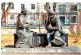
Помнік Сымону Буднаму і Васілю Цяпінскаму. Мінск

Прызнавалі сацыяльныя праблемы, аднак абаранялі дзяржаўны лад, бо лічылі, што змены ў грамадстве маюць адбыцца паступова