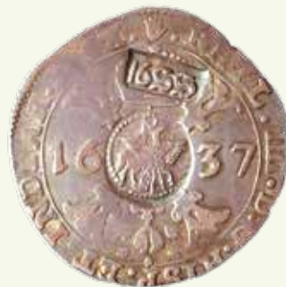
Яфімак з прызнакам. 1655 г.

20–30 км у суткі, для асобных экіпажаў — 40–50 км, для вершнікаў — да 70–80 км. У 1688 г. з Варшавы да Магілёва можна было даехаць за 13 дзён.