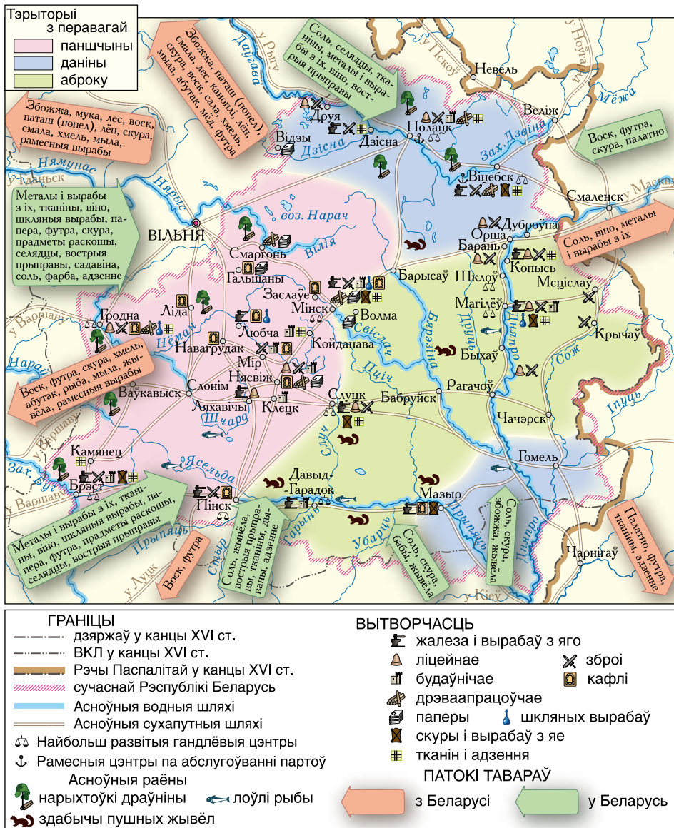
Эканоміка Беларусі ў XVI — першай палове XVII ст.

Выкарыстоўваючы інфармацыю з картасхемы, раскажыце пра эканамічнае развіццё Беларусі ў XVI — першай палове XVII ст.