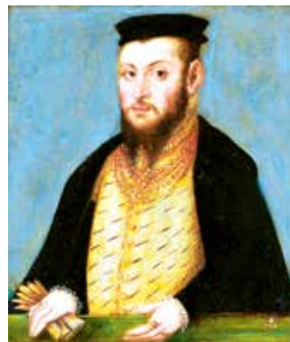
Жыгімонт II Аўгуст

Чаму рэформа атрымала назву «валочная памера»?