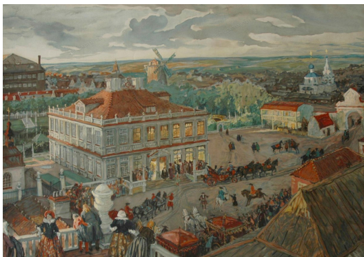
У Нямецкай слабадзе. Мастак А. М. Бенуа. 1911 г.

У Расіі былі знаёмыя з ладам жыцця еўрапейцаў («немцаў», як звалі тады ўсіх замежнікаў з Захаду). У Маскве ад сярэдзіны XVII ст. існавала Нямецкая слабада, у якую былі пераселены ўсе чужаземцы, што жылі ў сталіцы і не прынялі праваслаўе. Жыхарамі слабады былі замежнікі, што трапілі ў палон, гандляры, вайскоўцы на рускай службе і інш. Але яе ўплыў на расійскае грамадства быў зусім нязначны.