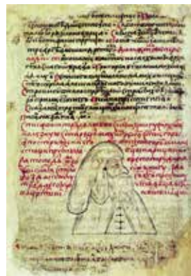
Партрэт Максіма Грэка. Малюнак са Збору твораў Максіма Грэка. Канец XVI ст.

такты, намячаецца рост эканомікі і разам з тым — нарастанне актыўнасці гарадскога насельніцтва. У сярэдзіне XVI ст. адбылося афармленне дзяржаўных устаноў, у выніку чаго вырасла патрэба ў пісьменных людзях. Усё гэта вяло да з'яўлення новага стылю жыцця, мыслення, цікаўнасці да ведаў. У грамадска-палітычнай думцы новыя рэаліі знайшлі адбітак ва ўмацаванні ідэі самацэннасці чалавека. Запрошаны з Грэцыі для выпраўлення богаслужбовых кніг Максім Грэк у сваім «Вызнанні веры» зацвярджаў «права на разнадумства» ў спрэчках пра «самаўладдзе» чалавека. Так у рускую грамадскую думку было ўнесена адно з найважнейшых палажэнняў заходнееўрапейскага гуманізму.