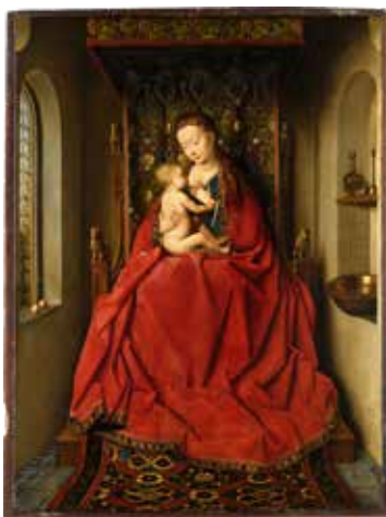
Лукская мадонна. Ян ван Эйк. 1437 г.

Мастацкая культура італьянскага Рэнесансу ў краінах Заходняй і Цэнтральнай Еўропы змяшалася з мясцовымі традыцыямі ў архітэктуры, скульптуры, жывапісе. Вялікае пашырэнне атрымала кнігадрукаванне. Яно спрыяла ўдасканаленню тэхнікі гравюры.