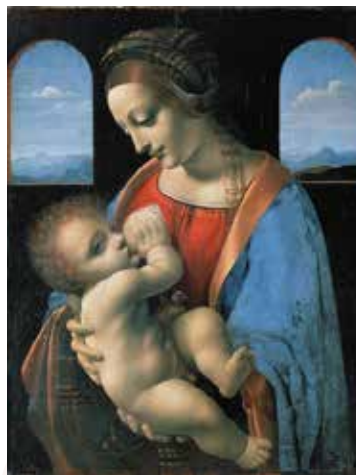
Мадонна Літа. Леанарда да Вінчы. 1490–1491 гг.

Параўнайце прыведзеныя творы вядомых аўтараў. Што ў іх творчасці нагадвае нам пра Сярэднявечча, а якія рысы характарызуюць аўтараў як мастакоў Адраджэння?