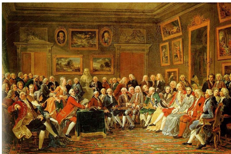
Чытанне «Трагедыі пра Чынгісхана і яго сыноў» Вальтэра ў салоне мадам Жафрэн. Мастак А. Леманье. 1812 г.

разнастайныя, аднак перш за ўсё гэта было друкаванае слова: кнігі, трактаты, памфлеты. Працы Дж. Лока, Ж.-Ж. Русо, Т. Джэферсана і іншых мысляроў Асветніцтва перакладаліся на розныя мовы, часта абмяркоўваліся ў салонах, універсітэтах і прыватных бібліятэках, дзе сустракаліся філосафы, пісьменнікі і іншыя цікавыя, адукаваныя людзі.