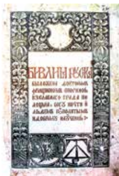
Тытульны аркуш з Бібліі Ф. Скарыны. Прага. 1519 г.

Выкарыстоўваючы дадатковыя крыніцы інфармацыі, вызначце паходжанне слоў: «чынш», «бровар», «фальварак».