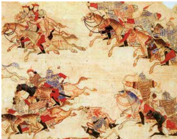
Мініяцюра са «Зборніка летанісаў». XV ст.

Вынікам заповалення развіцця цывілізацый Усходу ў Познім сярэднявеччы была іх няздольнасць супрацьстаяць еўрапейскай каланіяльнай экспансіі ў Новы час.