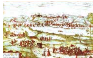
Гродно в 1568 г. Гравюра конца XVI в.

4. Развитие внутренней и внешней торговли. Развитие ремесленного производства содействовало расширению торговли, как внутренней, так и внешней.