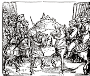
Изображение битвы при Чашниках (на р. Улла) в немецком летучем листке. 1564 г.