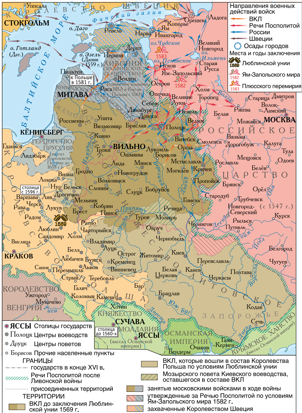
Ливонская война 1558–1583 гг.