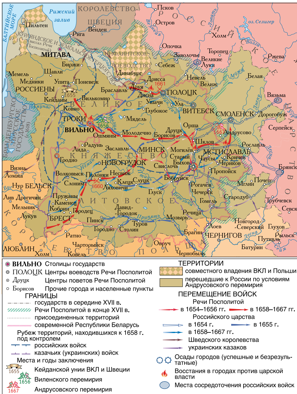
Территория Беларуси в войне Российского государства с Речью Посполитой 1654–1667 гг.

Воспользуйтесь картосхемой и дополните информацию о событиях войны 1654–1667 гг.