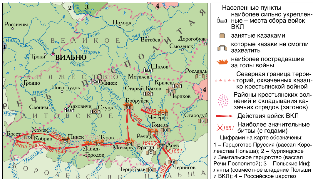
Казацко-крестьянская война 1648–1651 гг. на территории Беларуси

воеводства. 31 июля 1649 г. он потерпел тяжелое поражение в битве под Лоевом. Путь на Киев для армии ВКЛ был открыт. В этих условиях Б. Хмельницкий заключил с польским королем Зборовский мир , который предусматривал вывод из Беларуси повстанческих отрядов и создание в Украине казацкой автономии.