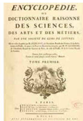
Титульный лист «Энциклопедии». XVIII в.

Используя дополнительные источники информации, узнайте, почему «Энциклопедию» Д. Дидро можно назвать проводником идеологии Просвещения.