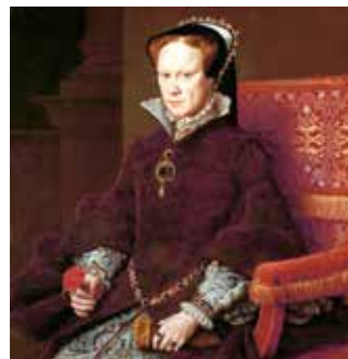
Портрет Марии I. 1554 г.

Религиозные войны — ряд вооруженных столкновений в Европе в XVI–XVII вв. между протестантами и католиками.