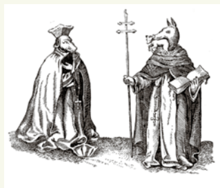
Иезуиты. Карикатура. XVII в.

Контрреформация проходила с переменным успехом. Если католицизму удалось сохранить влияние в Южной Европе и Польше, то протестантизм укрепил свои позиции в Северной Европе и большей части Германии. Вместе с тем Контрреформация оказала значительное влияние на формирование современного облика католической церкви.