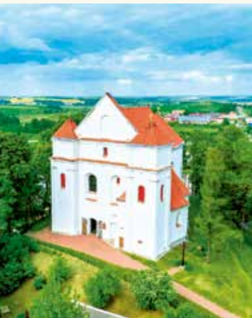
Фарный костел Преображения Господня в Новогрудке. Современный вид

Дополните информацию о событиях, происходивших в стенах храма в разное время.