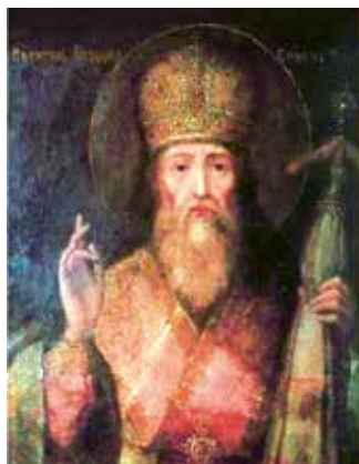
Митрополит Литовский и всея Руси Григорий Цамблак