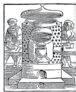
Дистилляционный аппарат. VIII в.