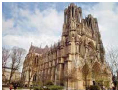
Реймский собор. Франция