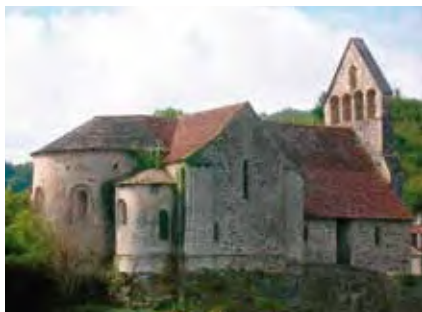
Капелла кающихся грешников. Франция