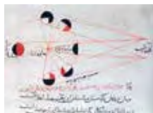
Фазы Луны. XI в.