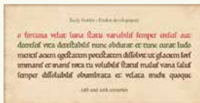
Пример готического шрифта