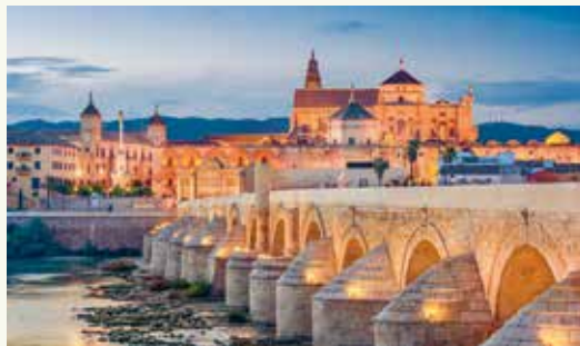
Исторический центр Кордовы. Испания. Современный вид