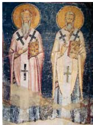
Святые Кирилл и Мефодий. Фреска собора Святой Софии. Македония. XI в.