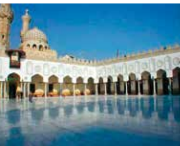
Университет Аль-Карауин. Марокко. Современный вид

Преподаватели и студенты жили в специально обустроенных общежитиях — коллегиях. Здесь проводились лекции: преподаватель зачитывал отрывки из книг известных ученых и богословов, а затем объяснял значение прочитанного.