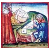
Европеец и араб, изучающие геометрию