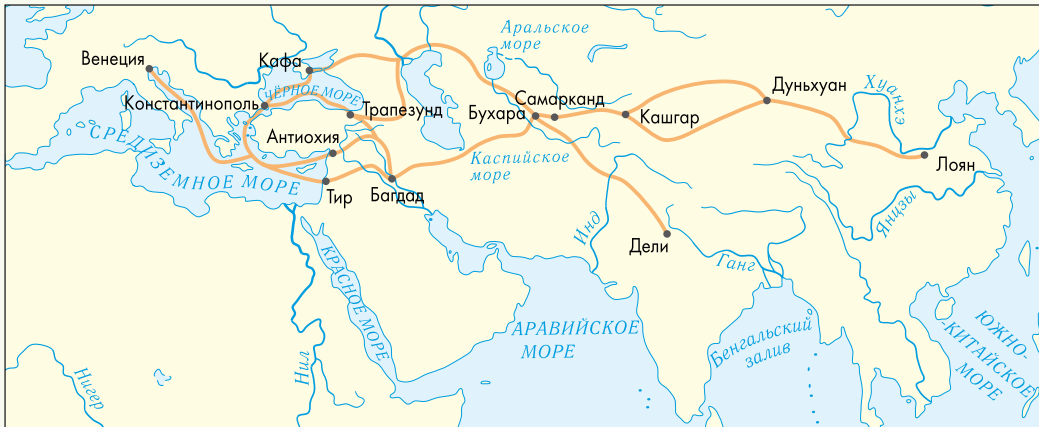
Великий шелковый путь