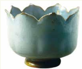
Фарфоровая чаша «Лотос» династии Сун

В конце XIII в. путешественник Марко Поло познакомил Европу с китайским фарфором. С тех пор спрос на эти изделия был огромен. Европейцы не раз пытались наладить подобное производство. Профессиональные «промышленные шпионы» отправлялись в страны Востока, чтобы разузнать секрет изготовления фарфора. Однако в Европе он был раскрыт только в начале XVIII в.