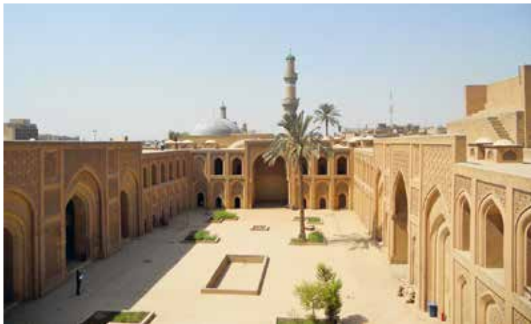
Багдад. Ирак. Дворец Аббасидов. Конец XII — начало XIII в.

по сути, инструментом политики и поддержания власти.