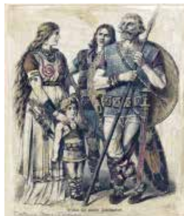
Семья древних германцев

2. Расселение германских племен в Европе и Северной Африке. Расселение германских племен в Европе и Северной Африке в IV–VII вв. ознаменовало значительную трансформацию социально-политического ландшафта древнего мира. Когда Западная Римская империя начала приходить в упадок, различные