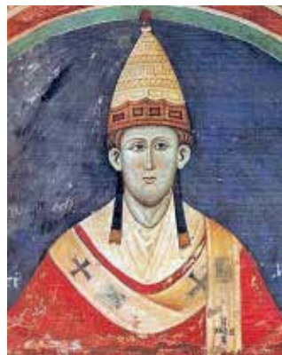
Иннокентий III. 1219 г.

Составьте сравнительную таблицу «Положение церкви в Византии и в Западной Европе». Критерии для сравнения (не менее трех) разработайте самостоятельно. Сделайте вывод.