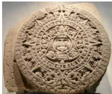
Камень Солнца — один из старейших памятников ацтекской культуры. Мехико

Религиозные верования африканских и американских народов в Средневековье обслуживало жрецство. Это была очень влиятельная прослойка общества. Жрецы контролировали духовную жизнь населения, совершали обряды и гадания, предсказывали погоду, лечили больных.