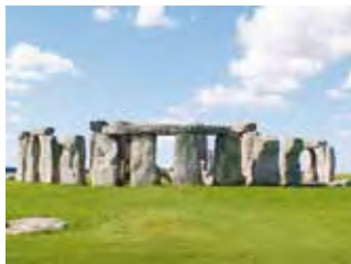
Стоунхендж. Бронзовый век. Великобритания

К числу наиболее загадочных явлений первобытного искусства относятся мегалиты — сооружения из каменных, минимально обработанных глыб, выстроенных в определенном порядке. В Европе обнаружено около 35 тыс. мегалитов. Одним из самых знаменитых является Стоунхендж. Он был построен в те времена, когда еще не были изобретены ни блок, ни колесо. Строители могли пользоваться только самыми примитивными инструментами — деревянными катками и веревками. Для своей эпохи Стоунхендж представлял