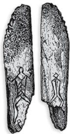
Изображение на кости. Озеро Вечера. Любанский район Минской области