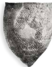
Неолитический сосуд. Рогачевский район Гомельской области