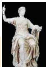
Муза Клио. Императорская вилла под Римом. II в.