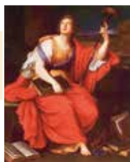
Клио. Художник П. Миньяр. XVII в.