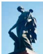
Клио на памятнике российскому историку Н. М. Карамзину. Россия. XIX в.

Прекрасная Клио считалась одной из девяти муз Древней Греции. Этот мифологический образ сохраняется в искусстве на протяжении всей истории. Перечислите представленные виды искусства. Что символизируют труба и свиток (книга) в руках Клио, с которыми ее обычно изображают? Каково значение истории в жизни общества?