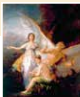
Правда, время и история. Художник Ф. Гойя. XVIII в.