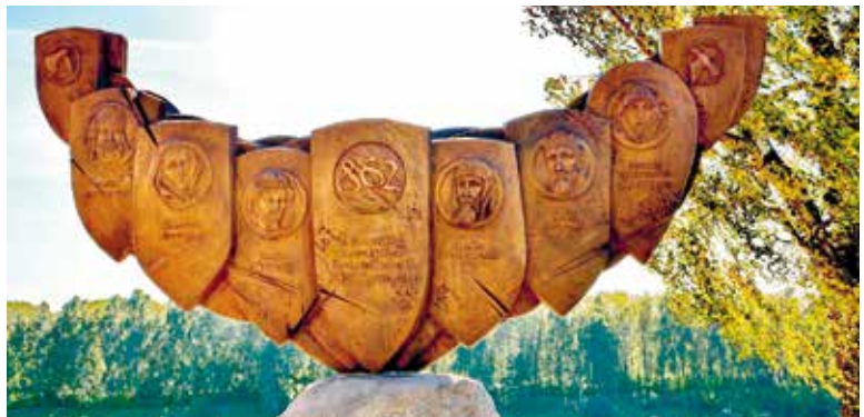
Памятник «Полоцк — колыбель белорусской государственности»

Ученые выделяют более двадцати локальных цивилизаций. Они различаются структурой общества, формой правления, традициями и обычаями, образом жизни, культурой. Важную роль в формировании цивилизаций сыграла религия. Невозможно, например,