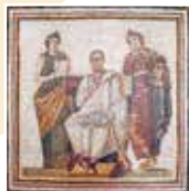
Вергилий, пишущий «Энеиду» под вдохновением муз Клио и Мельпомены. Тунис. III в.